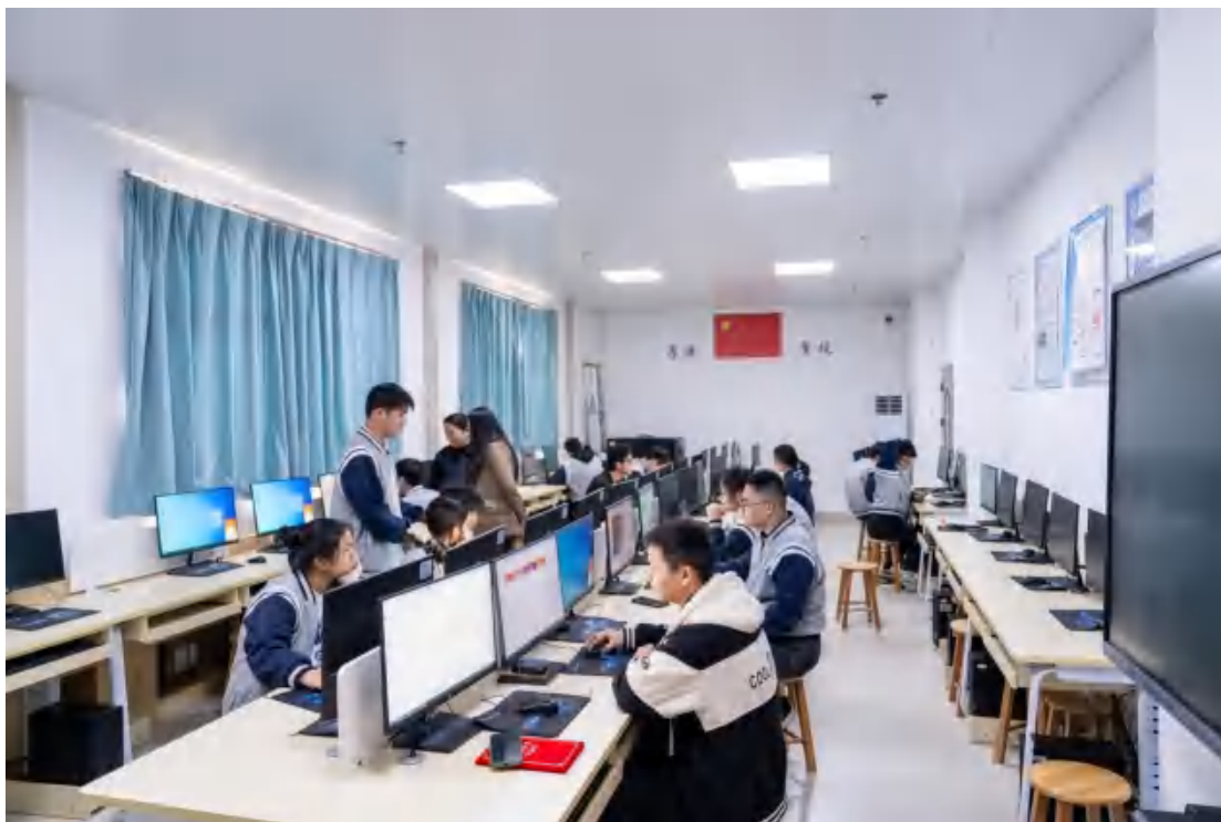
图 3-5 基地实训教室 5

在硬件设备配置方面，公司坚持“适度超前、实用够用”的原则。为合作院校配置了高性能计算机工作站、专业级直播设备、智能仓储管理系统等先进设备。特别是在直播实训室建设上，配备了 4K 摄像机、环形补光灯、绿幕背景等专业设备，满足跨境直播电商的教学需求。所有设备均按照企业真实工作环境的标准进行配置，确保学生能够接触到行业最前沿的技术工具。