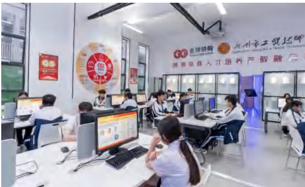
图 3-2 基地实训教室 2