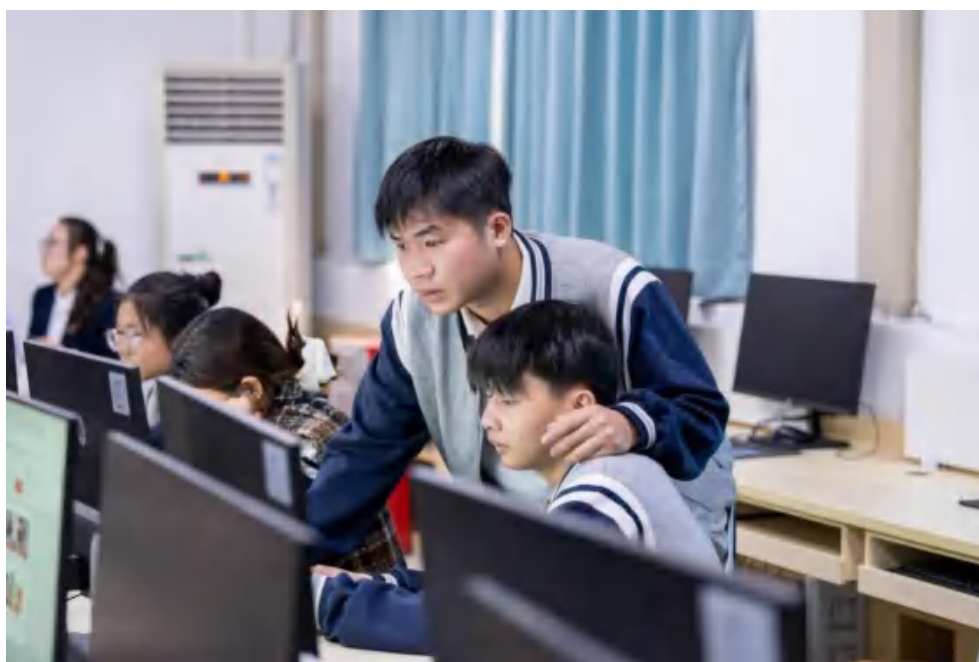
图 4-3 学生能力实践

在培养模式创新方面，公司推行“三段递进、四维融合”的培养模式。“三段递进”即基础能力培养、专业能力培养、综合能力培养三个递进阶段；“四维融合”即理论与实践融合、学校与企业融合、学习与工作融合、就业与创业融合。这种模式确保了学生知识、能力、素质的协调发展。