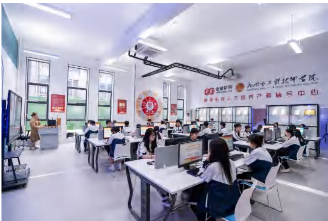
图 3-4 基地实训教室 4