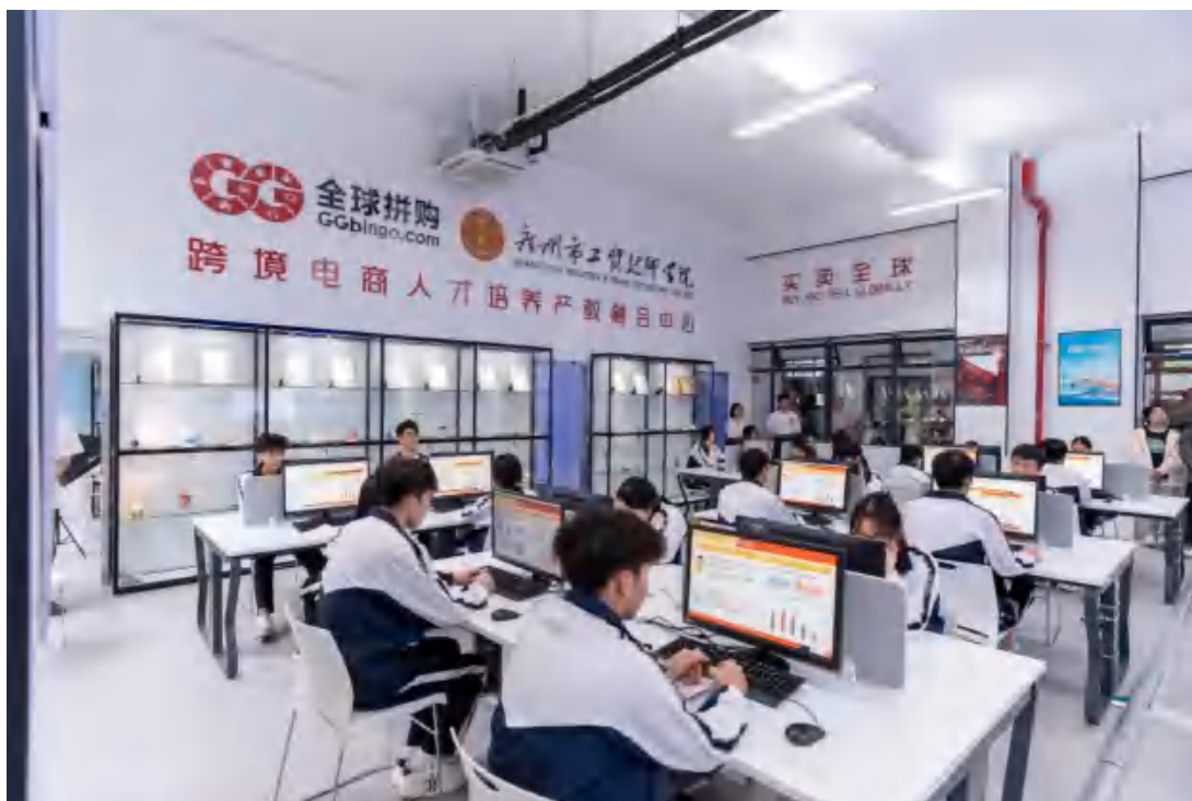
图 3-3 基地实训教室 3