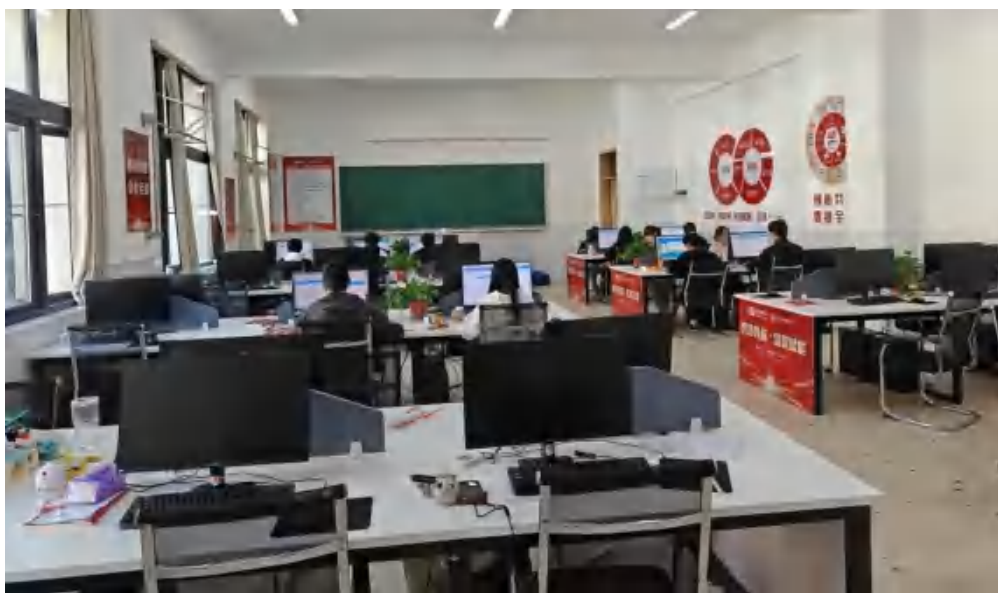
图 3-1 基地实训教室

公司在实训基地建设方面投入了大量资源，致力于打造与行业技术发展同步的现代化实训环境。2025 年，公司在实训基地建设方面的总投入达到 1200 万元，其中硬件设备投入占 40%，软件平台投入占 30%，环境建设投入占 20%，运营维护投入占 10%。