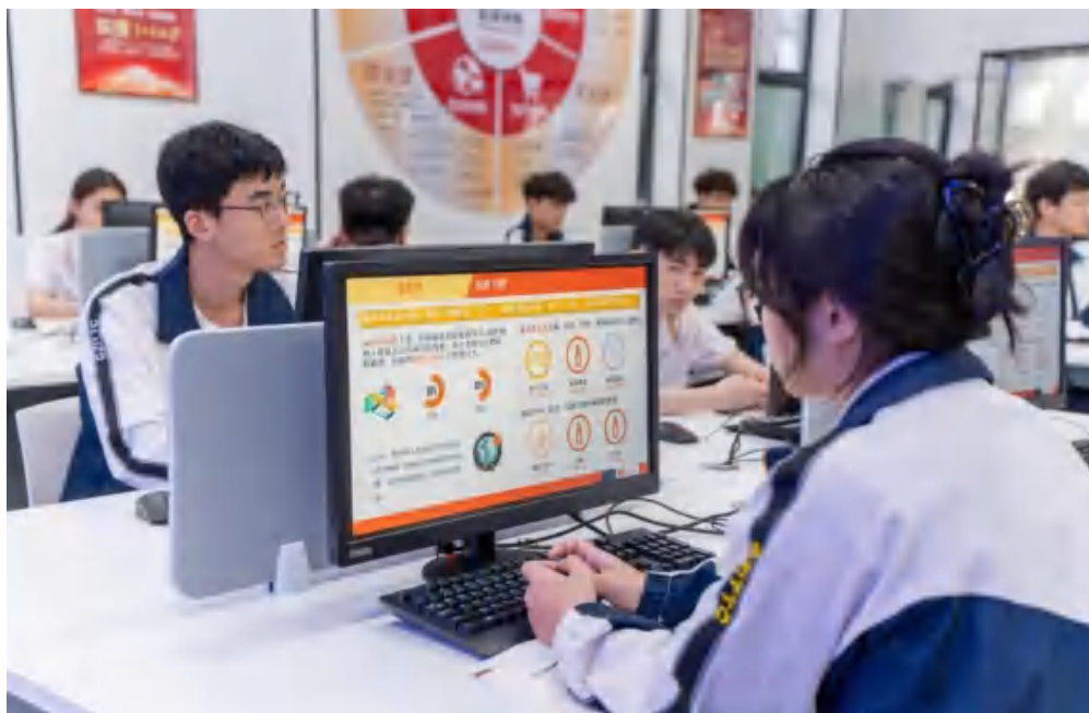
图 4-2 学生能力培养

在培养模式创新方面，公司推行“三段递进、四维融合”的培养模式。“三段递进”即基础能力培养、专业能力培养、综合能力培养三个递进阶段；“四维融合”即理论与实践融合、学校与企业融合、学习与工作融合、就业与创业融合。这种模式确保了学生知识、能力、素质的协调发展。